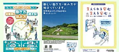
各制度に関するリーフレット(例)

「勤務間インターバル制度」「年次有給休暇の計画的付与制度」「時間単位の年次有給休暇」「特別な休暇制度」などについて、企業の取組事例の紹介や、リーフレットなどの資料を掲載しています。